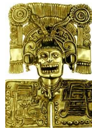
(Pectoral de Oro, Cultura Mixteca)

Mixtecos, significa: “país de las nubes”, construyeron Necrópolis de Mitla, la ciudad se convirtió en cementerio de sus reyes, ahí también se encuentra el palacio de los Grecas, fueron maestros del arte suntuario, trabajaron piedras como la jadeíta, cristal de roca, amatista, ágata y obsidiana. En sus manifestaciones artísticas eran grandes poetas.