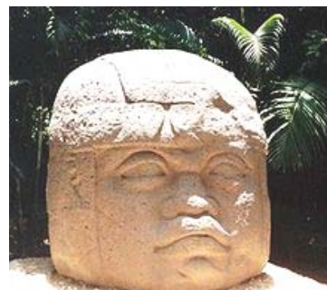
(CabezaOlmeca, La Venta)

Según historiadores es la primera civilización de mesoamérica, muchas creaciones se atribuyen a ellos, como el calendario, la escritura y la epigrafía. Aún no se sabe con exactitud su origen y antigüedad pero se mayor auge fue en los siglos VI y V a.C. en extensión territorial abarca desde el sureste de Veracruz hasta el oeste de Tabasco. El arte olmeca se distingue por las esculturas monumentales llamadas “Cabezas colosales olmecas”, que representan guerreros o jefes, algunas están ubicadas en La Venta, (donde fueron enterradas quizá por que se trataba de enemigos), ahí se encuentra la pirámide más antigua de Mesoamérica. A esta civilización también se le conoce como “Dios del Jaguar” por las representaciones en esculturas y figuras del Jaguar. Otras esculturas eran representaciones masculinas, niños mongoloides, seres híbridos, estelas, sarcófagos.